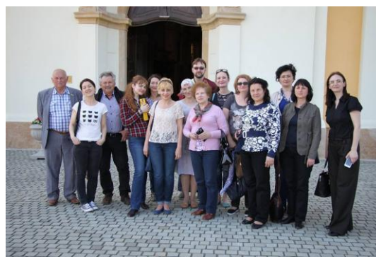
Mănăstirea de la Radna