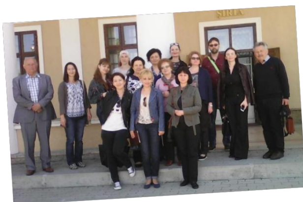
Muzeul „Ioan Slavici” de la Șiria

La sfârșitul programului de mobilitate Centrul de Relații Internaționale al Universității de Vest „Vasile Goldiș” a organizat o excursie extrem de interesantă pentru profesorii universitari din Moldova, Rusia și Ucraina prin locurile istorice importante ale județului Arad.